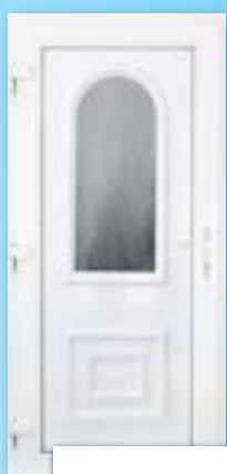
NEPTUN 1 ÜVEGES