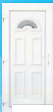
EURÓPA 1 ÜVEGES