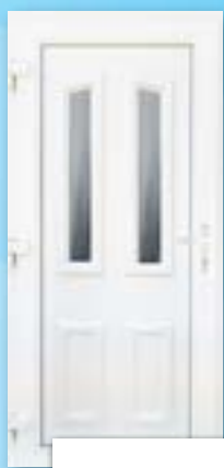
CERES 2 ÜVEGES