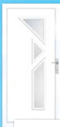
VENUS 3 ÜVEGES