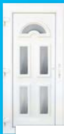
EURÓPA 5 ÜVEGES