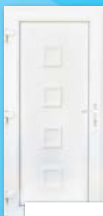
MG 0 TÖMÖR