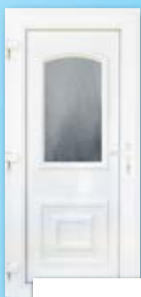
JUPITER 1 ÜVEGES