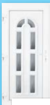
MERCUR 8 ÜVEGES