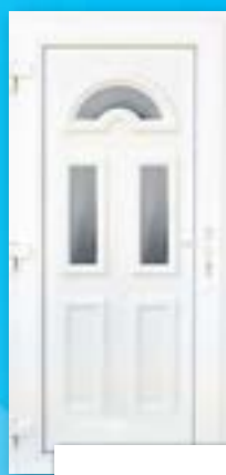
EURÓPA 3 ÜVEGES