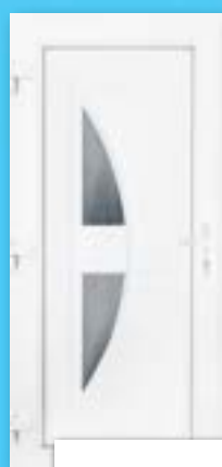
TETHYS 2 ÜVEGES