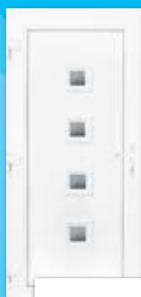
MG 4 ÜVEGES